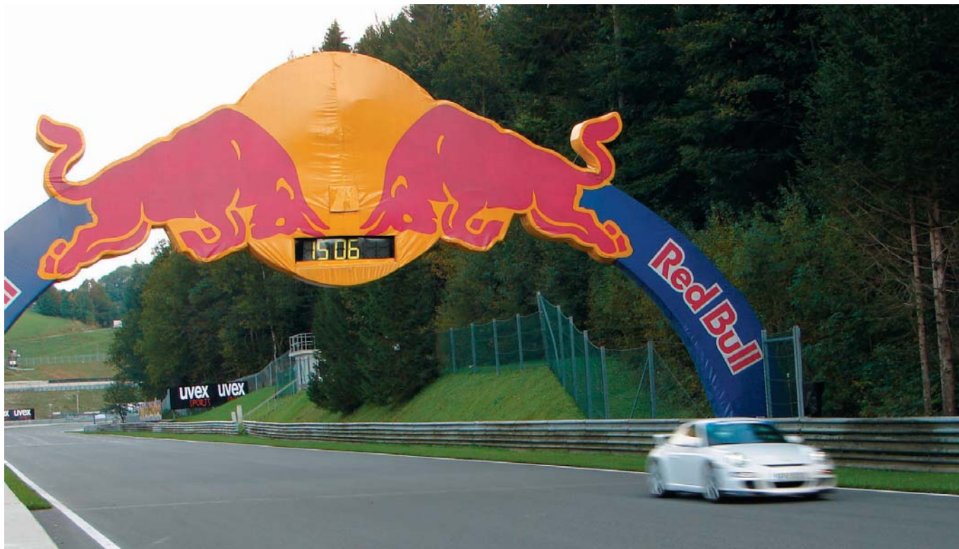
Start und Zielgerade am Salzburgring