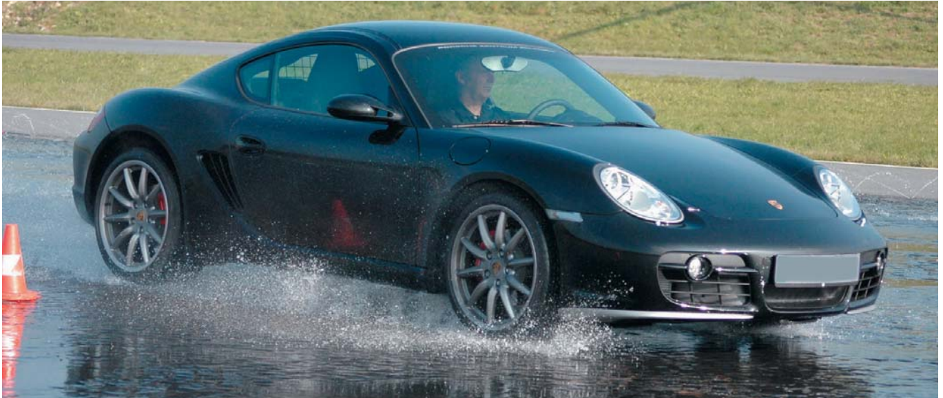
z.B. ABS/Vollbremsung auf einem bewässerten Belag...